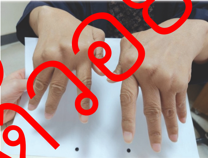
รูปที่ 4 ข้อโคนนิ้วโป้งนิ้วก้อยเบี้ยวไปทางด้านกระดูก ulna (metacarpophalangeal joint subluxation with ulnar deviation)